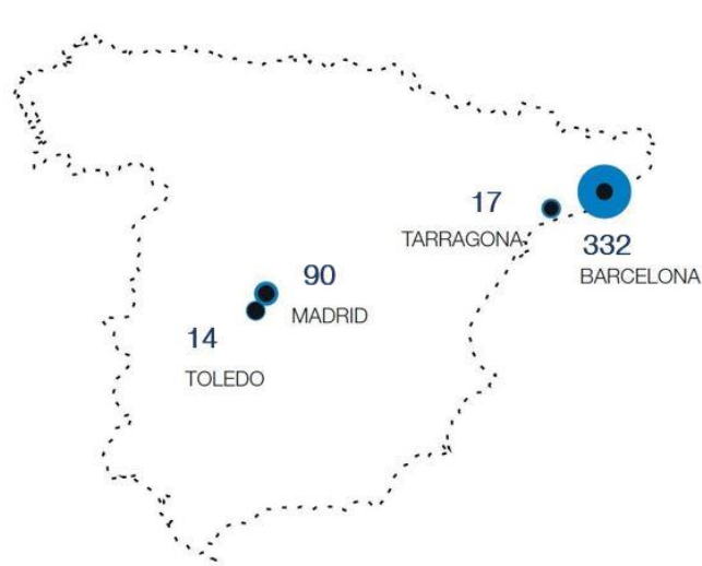
Distribución geográfica de la plantilla

El promedio de la plantilla de Fundación CARES durante el 2019 es de 453 personas distribuidas entre los centros de Barcelona, Madrid, Tarragona y Toledo con orígenes y nacionalidades muy diversas: